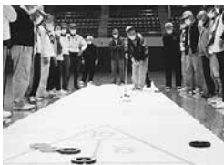
シャッフルボード