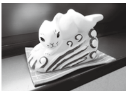
素焼き人形「因幡の白兔」

土台になっっている日本海の荒波を表現するのに苦労し、人形の顔は命とばかりに個性的に仕上げたグループと、これだけは匠に依頼して品良い記念品としたグループとに分かれました。京都の伏見人形と並び、日本の土人形の源流と呼ばれている堤人形の教室でした。