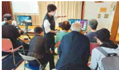
初体験に前のめり

参加者はゲームをしたことがない方がほとんどで、おそろおそろコントローラーを握る方もいらつしやいました。初めての体験を楽しんでいただけようです。「孫たちはこういうのをやってるんだな」というお声もあり、ご家族との話題に取り上げてみてほしいなと思えます。