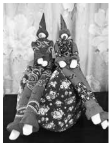
バンドナ1枚から生まれたピエロ

孤軍奮闘して作品を作り上げた満足感でみんな笑顔になりました。「やればできる」という自信にも繋がりました。大いにチャレンジ精神を育んでいこうと思います。